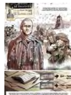
Śmierć na śmietniku Death on the Garbage Dump 10 ul. Radziszewskiego