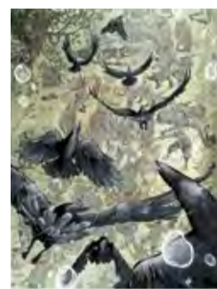
Na Majdanek... To Majdanek... 3 pl. Zamkowy