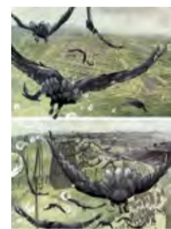
Przybycie do obozu Arrival at the Camp 4 ul. Krańcowa