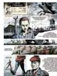
Wóz z chlebem The Bread Wagon 9 Al. Racławickie (Ogród Saski)