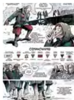
Oznakowanie więźniów Prisoner Markings 7 Muzeum na Majdanku (wejście / entrance)