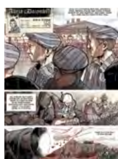
Akcja „Dożynki” The Harvest Festival 12 Muzeum na Majdanku (Mauzoleum / Mausoleum)