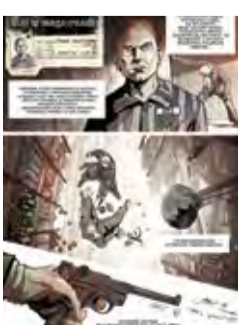
Opowieść Armbrustera Armbruster's Story 11 ul. Lipowa