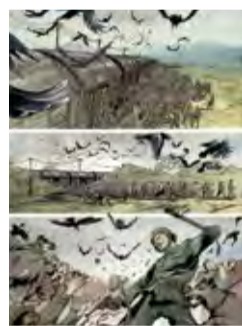
Wyładunek Unloading 2 pl. Litewski