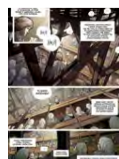
Radio Majdanek Radio Majdanek 14 ul. Kollątaja (Centrum Kultury / Centre for Culture)