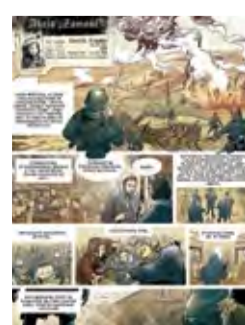
Akcja „Zamość” Aktion „Zamość” 13 pl. Wolności