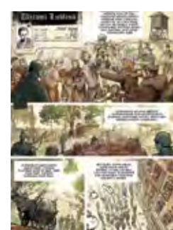
Na wolność... To Freedom... 15 pl. Łokietka