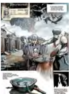
Głód Hunger 6 Krakowskie Przedmieście