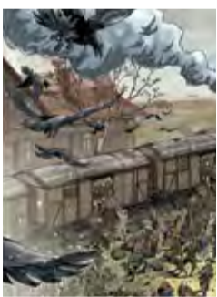
Koniec podróży End of the Journey 1 pl. Dworcowy